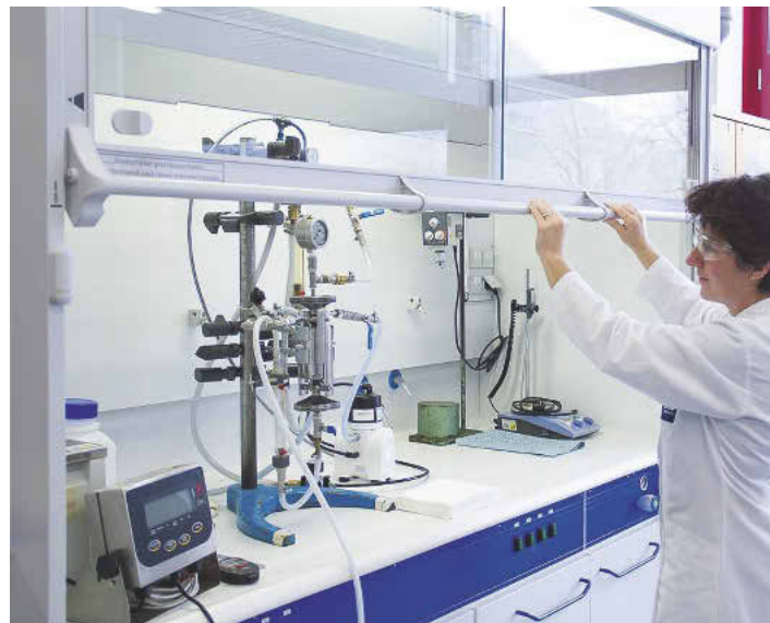
Die Tests im Filtrationslabor von BHS-Sonthofen untersuchen Filtermedium, Betriebsdruck und Kuchenstärke, um das optimale Design und die Größe des Filtrationssystems zu bestimmen